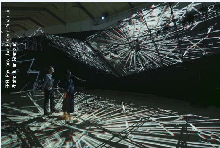
EPFL Pavilions, Uwe Rieger et Yinan Liu.